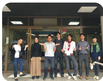
2017年奈良県吉野郡下市町から委託を受け、シモイチナジカン援農プロジェクトを実施。行政の方々との1コマ。