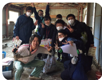
京都府南部の和東町・笠置町・南山城村の3自治体合同の「空き家片付けイベント」にて。