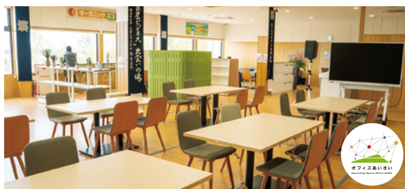
東とくしま農業協同組合 みはらしの丘あいさい広場