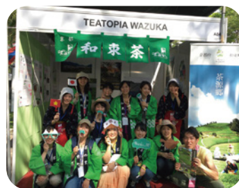
和東町と近畿日本ツーリスト、奈良女子大学と連携した、『ジャパンベトナムフェスティバル』での出店ブースの1コマ。