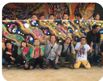
2018年『茶源郷まつり』にて、和東町で年に1度開催されるお茶の祭典の事務局をした時の写真。