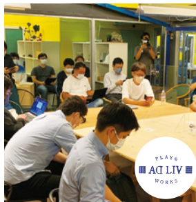
ナカガワ・アド株式会社 ADLIV