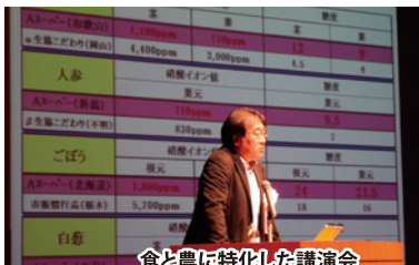
食と農に特化した講演会