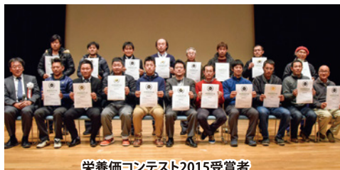
栄養価コンテスト2015受賞者